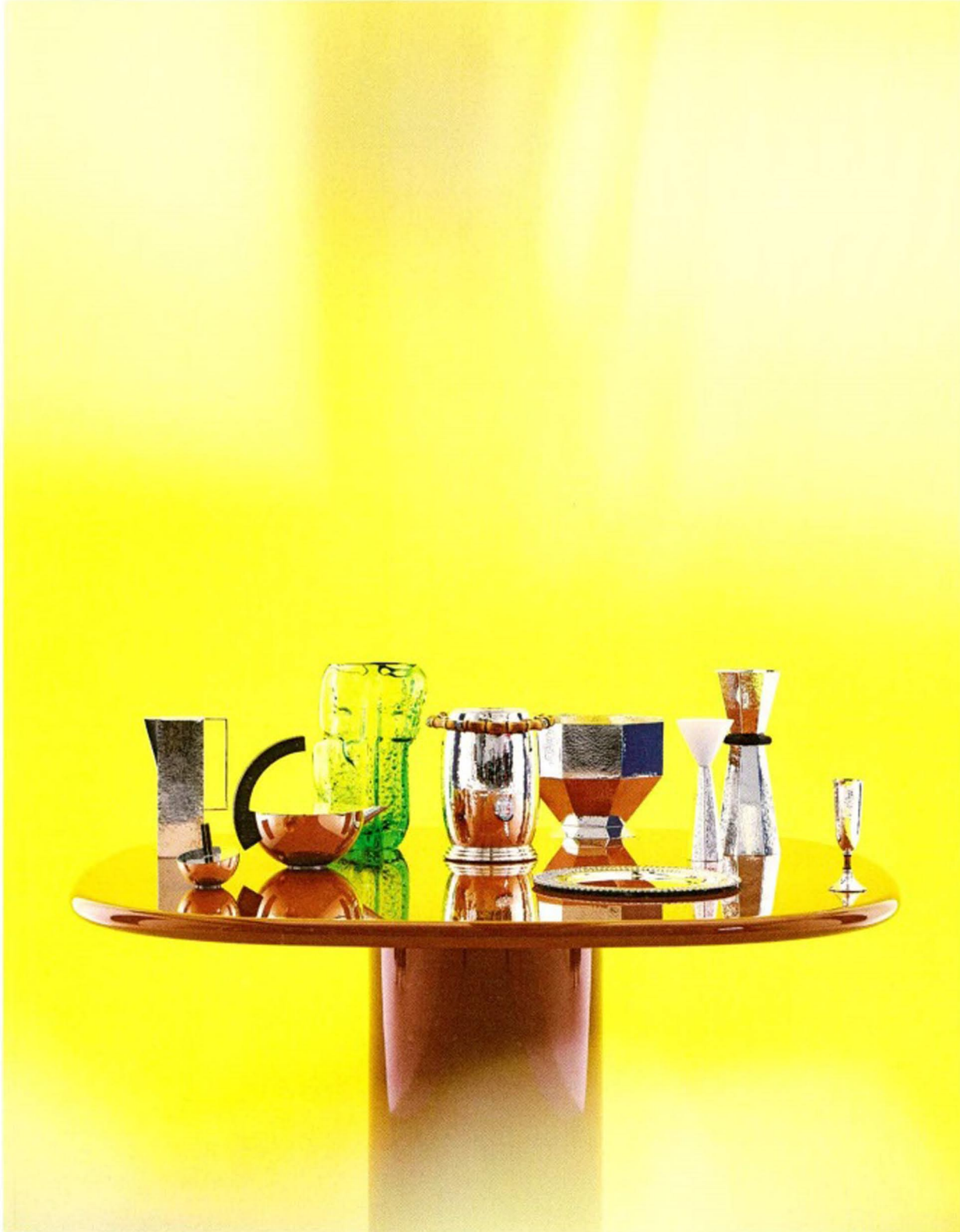
Tavolo Homan, laccato ambra, firmato Matteo Thun & Antonio Rodriguez per Desiree, diametro cm 138 (desiree.com).