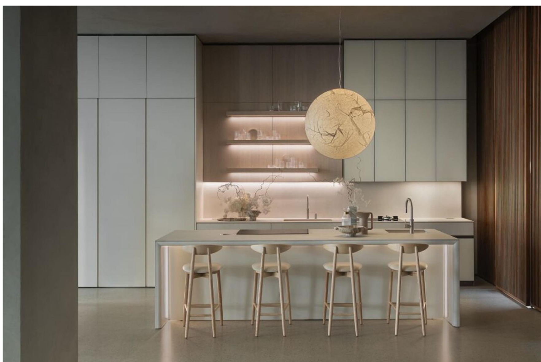
Kubic di Euromobil, presentato durante la MDW 2026