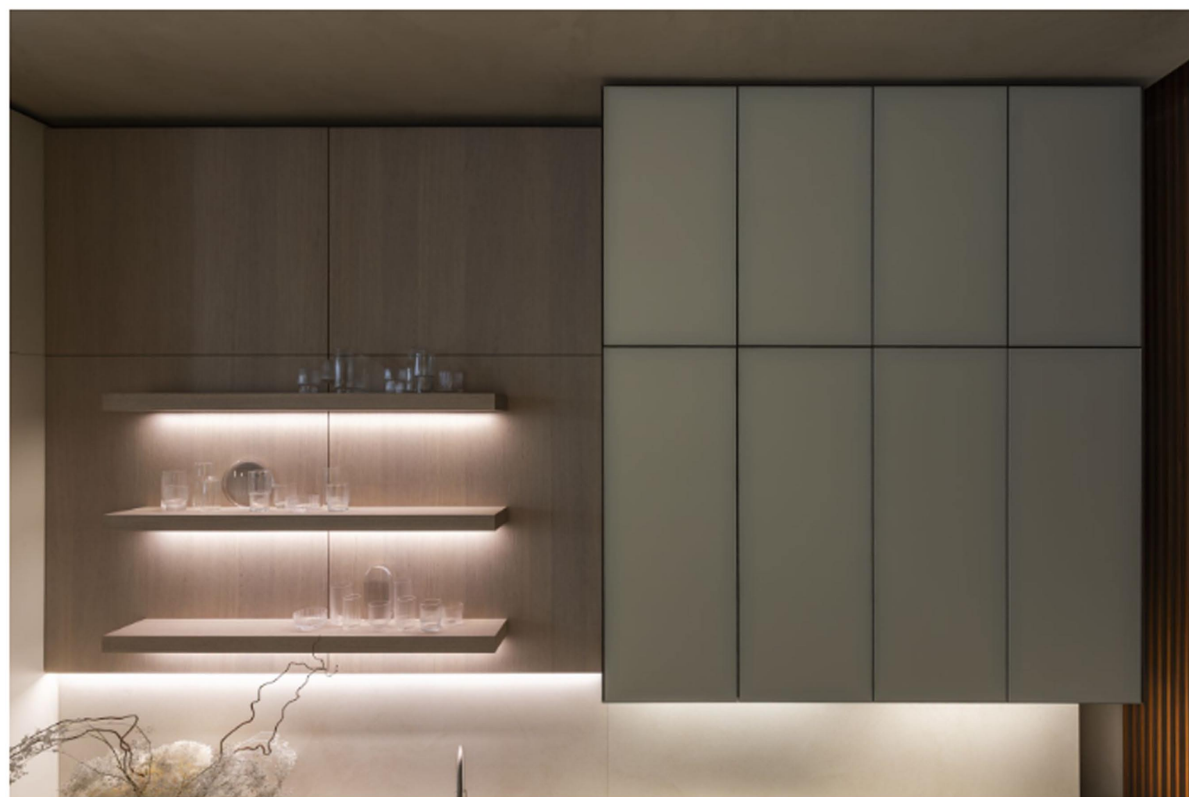
Euromobil, cucina Kubic: la boiserie Pariés

Anche nella boiserie Pariés le fughe tra i pannelli riprendono la scansione del telaio di Kubic : in tal modo, cucina e parete vengono percepite come parti di un unico disegno, in cui allineamenti, sovrapposizioni e rapporti tra pieni e vuoti generano una geometria elegante. Nelle immagini, Kubic è concepita come un sistema dal carattere preciso, costruito attraverso i dettagli , le linee e le proporzioni. Il progetto richiama una sensibilità compositiva di matrice orientale , dove l'identità nasce dalla misura, dalla cura del segno e dalla qualità delle relazioni tra gli elementi. Il risultato è un insieme essenziale, rigoroso, ma non freddo , capace di esprimere una sofisticata idea di equilibrio.