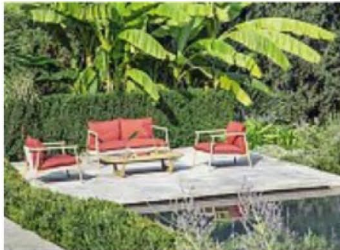
La linea Karin di Setsu & Shinobu Ito, che ripropone anche all'esterno le qualità tipiche di un prodotto indoor, come eleganza, comodità e versatilità

«L'assenza di separazione tra interno ed esterno ha cambiato il modo di progettare. Oggi non pensiamo più a due ambiti distinti, ma a uno spazio continuo che deve funzionare in condizioni diverse. Nel caso di Karim e Milos, questo si traduce in prodotti che mantengono lo stesso linguaggio del living interno, ma sono progettati per durare all'esterno. Non è un adattamento, è un'estensione del progetto. Abbiamo lavorato su comfort, proporzioni e materiali, mantenendo la stessa qualità percettiva che si ha in casa, ma con prestazioni adeguate all'outdoor. Questo equilibrio è