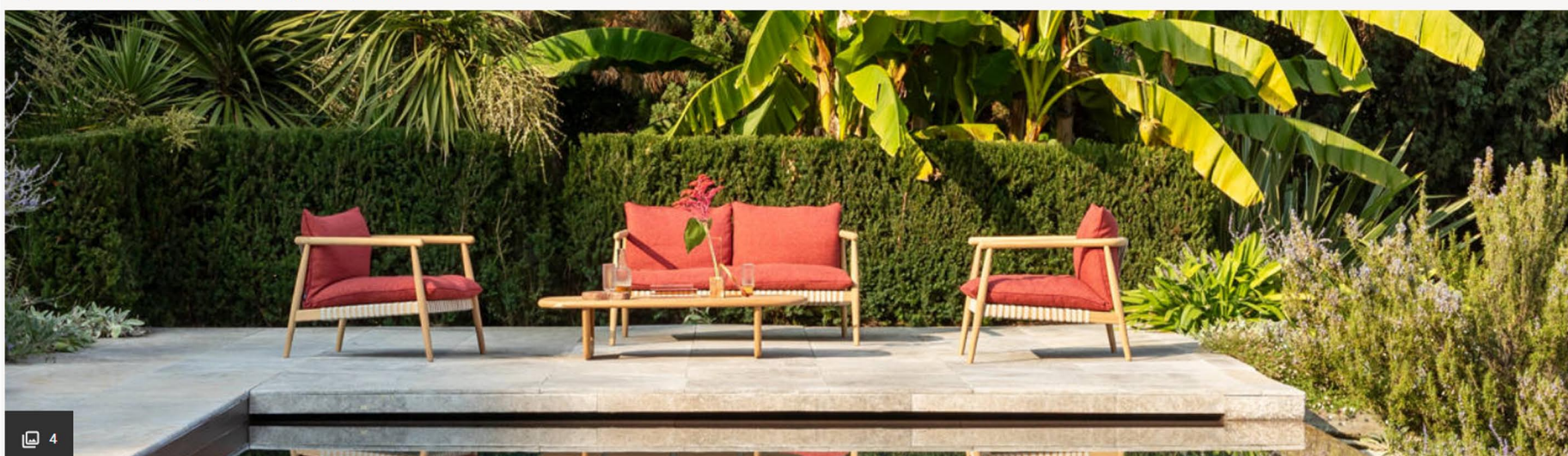
La collezione di arredi per esterni Desiree per il Salone del Mobile 2026

Magazine > Linee morbide e leggerezza visiva per il living open air