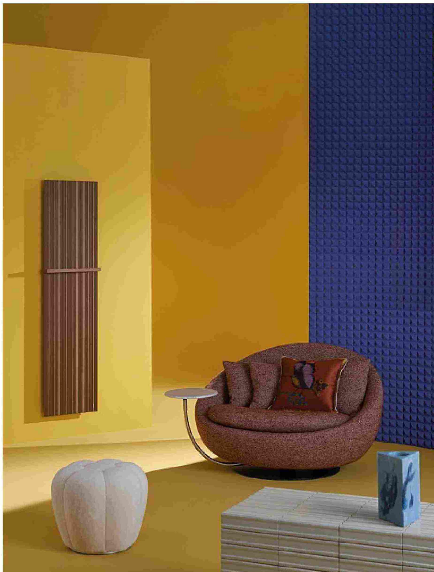
Puf Apex rivestito in tessuto Orsetto Flex, Sacha Lakic per Roche Bobois. Radiatore Tessuto in alluminio colore Corten, Marco Pisati per Cordivari. Poltrona Lacon rivestita in tessuto con tavolino in metallo e marmo, design Jai Jalan per Desiree. Cuscino La DoubleJ . In primo piano, piastrelle della collezione Mid in gres porcellanato, Way 3D Lino, Ragno. Vaso Block di Marco Guazzini