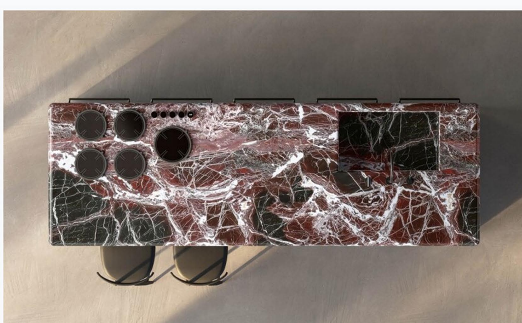
Margo Antis di Euromobil, design Roberto Gobbo, insieme al team R&S Euromobil, è la nuova proposta inserita nel catalogo Re-Design 3.

Disegnata dall'architetto Roberto Gobbo , insieme al team R&S Euromobil, questa nuova composizione è caratterizzata dalle colonne a parete Margo , dal sistema Levitas e dal piano con coprifianchi in marmo Rosso Levante , una presenza scultorea che, con le sue venature intense, si impone nell'ambiente con profondità cromatica. A completare il progetto, le basi Antis e le colonne Levitas .