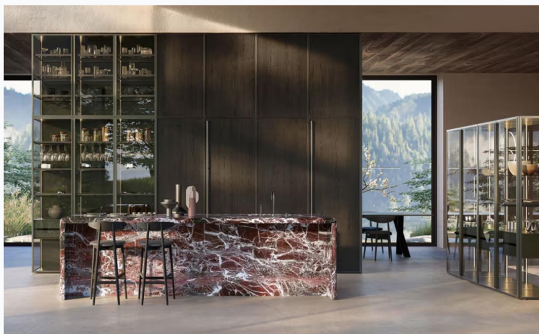
Le colonne a parete Margo , il sistema Levitas e il piano con coprifianchi in marmo Rosso Levante – materia viva e vibrante – restituiscono profondità cromatica 110 e identità scultorea all'ambiente.

Le seconde si presentano come volumi architettonici aperti, con vetro fumé e struttura in alluminio Bronzo satinato , unendo estetica e funzionalità in una trasparenza sofisticata e modulare.