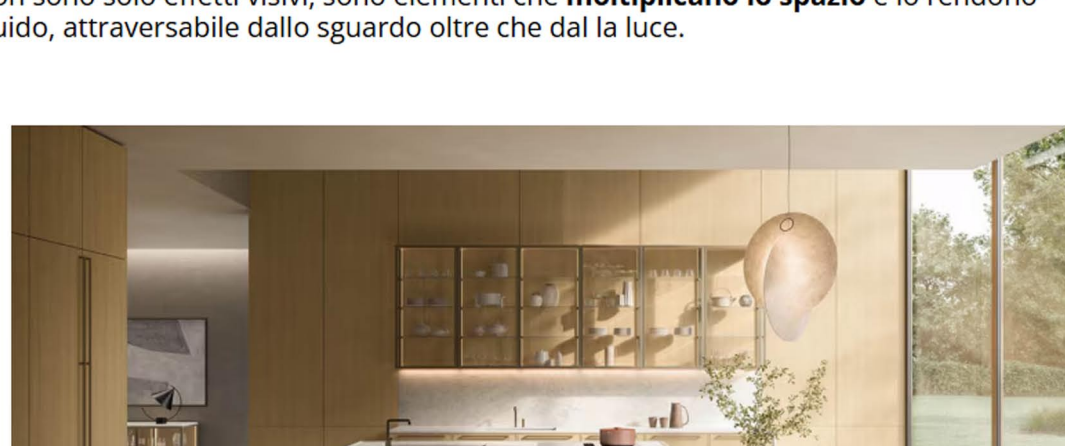
Il sistema modulare Levitas è in vetro extrachiaro.

Elemento distintivo è il sistema Levitas in vetro extrachiaro trasparente. Una presenza sofisticata dalla struttura modulare, che alleggerisce la composizione e lascia intravedere il contenuto, donando profondità e luminosità all'insieme. Le trasparenze non sono solo effetti visivi, sono elementi che moltiplicano lo spazio e lo rendono fluido, attraversabile e rarefazione visiva definisce una composizione in equilibrio tra opacità e riflesso, schermo e soglia.