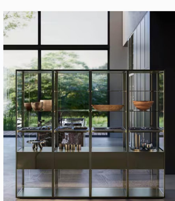
Le basi Antis in laccato metallizzato Bronzo satinato, sono caratterizzate dalle maniglie Giro nella stessa finitura.

Materiali pregiati e lavorazioni accurate che esaltano il valore dell'artigianalità. Altra protagonista è la luce che si riflette sulle superfici , corre lungo i bordi arrotondati del marmo, si insinua tra pieni e vuoti generando vibrazioni visive che definiscono l'intero spazio.