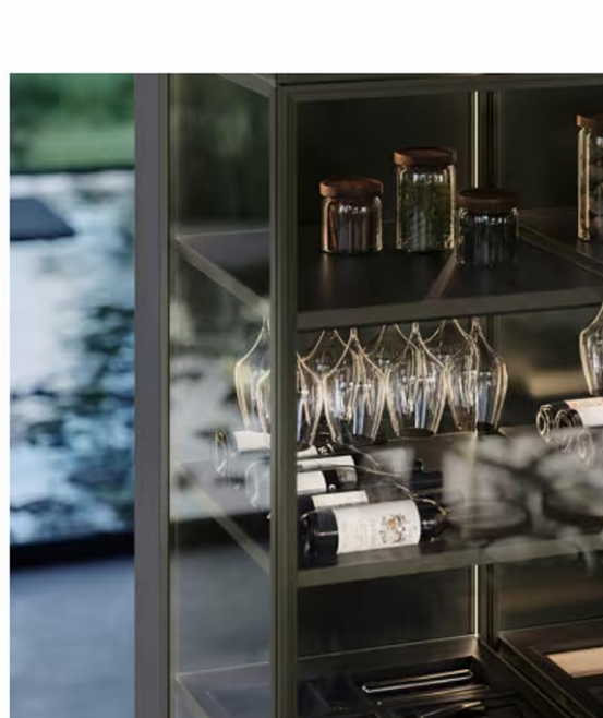
Le colonne Levitas con vetro fumé e struttura in alluminio Bronzo satinato completano la composizione.

Parte di Gruppo Euromobil , Euromobil non realizza semplici cucine o elementi di contenimento, ma vere e proprie strutture architettoniche che ridisegnano gli spazi , li reinventano, li modificano e li modellano a seconda dell'ambiente che si desidera creare.