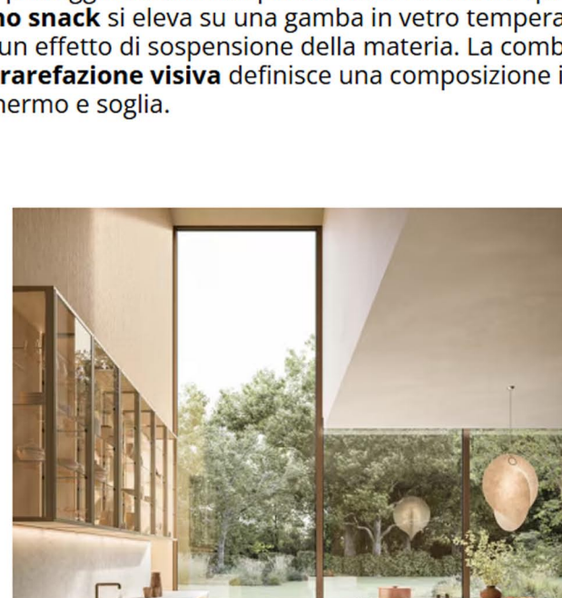
Il piano snack (sotto) con gamba in vetro temperato, anch'esso extrachiaro

L'interior si va così a caratterizzare per i giochi di riflessi e per gli accenni visivi che svelano il contenuto, proteggendolo al tempo stesso. A rafforzare questa idea di levità architettonica, il piano snack si eleva su una gamba in vetro temperato extrachiaro che, quasi invisibile, crea un effetto di sospensione della materia. La combinazione tra solidità strutturale e rarefazione visiva definisce una composizione in equilibrio tra opacità e riflesso, schermo e soglia.