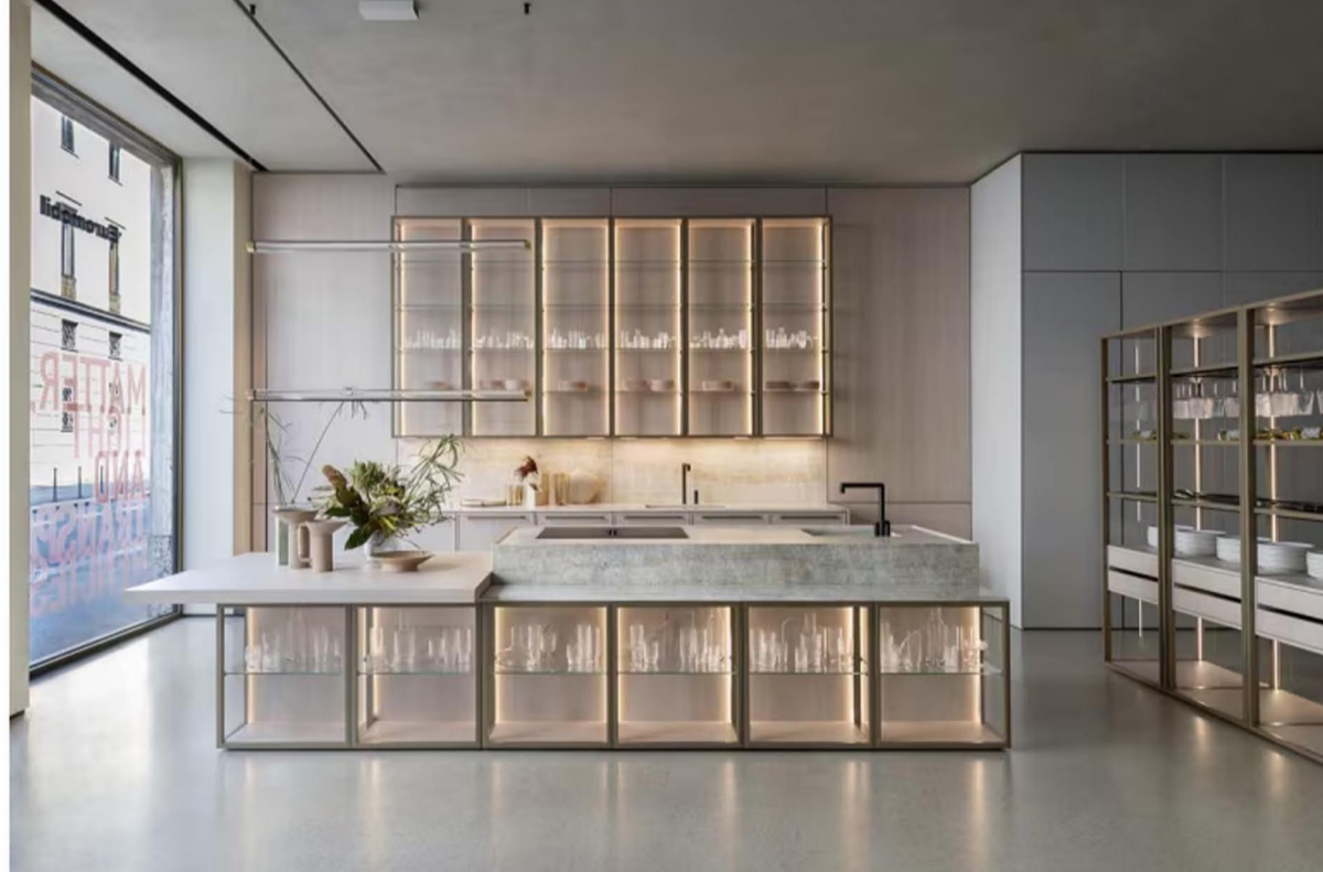
Levitas, ispirata alla leggerezza e al dinamismo dell'aria, si esprime in un gioco di volumi slanciati, materiali trasparenti e dettagli essenziali.

Margo (dal latino margo: margine, limite, orlo, confine) celebra il rigore e l' eleganza strutturale attraverso la cornice perimetrale di 14 mm, segno sottile che racchiude il senso profondo del progetto: precisione, equilibrio e savoir-faire manifatturiero.