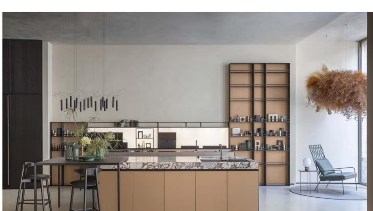
La cucina SEI, che prende il nome dallo spessore ultrasottile di 6 millimetri, è un esercizio di purezza formale e leggerezza strutturale.

L'innovazione progettuale trova ulteriore espressione nel lavoro di Marc Sadler, con la cucina SEI , riproposta nella finitura laccato anodizzato Bronze . SEI , che deve il nome allo spessore ultrasottile di 6 millimetri, è un esercizio di purezza formale e leggerezza strutturale, dove la tecnica incontra il linguaggio architettonico per una cucina che è essenza e struttura al tempo stesso.