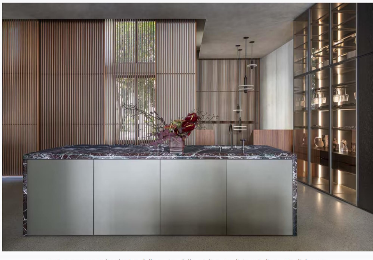
Antis rappresenta l'archetipo della cucina della migliore tradizione italiana. Un dialogo tra passato e futuro, tra materiali dal sapore artigianale e tecnologie di ultima generazione, dal gusto elegante ed essenziale.

C' è un nuovo modo di vivere lo spazio cucina , superando il concetto di componibile tradizionale: rompere gli schemi, abbandonare la rigidità dei moduli standard, abbracciare soluzioni su misura , flessibili, pensate per adattarsi a ogni stile di vita. Design, funzionalità e libertà creativa si fondono per dare vita ad ambienti che riflettono la propria personalità. Euromobil è andata oltre questo concetto tradizionale di cucina, creando vere e proprie strutture architettoniche capaci di trasformare, modellare e dare forma agli spazi.