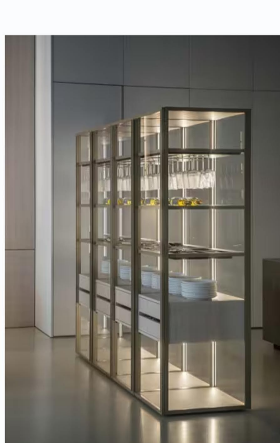
Ogni progetto nasce da una profonda attenzione per i materiali, per il saper fare artigianale e per un design che dialoga con l'architettura.

Protagoniste sono Levitas , Margo e Antis , cucine firmate dall'architetto Roberto Gobbo con il team R&S Euromobil . Levitas , ispirata alla leggerezza e al dinamismo dell'aria, si esprime in un gioco di volumi slanciati, materiali trasparenti e dettagli essenziali.