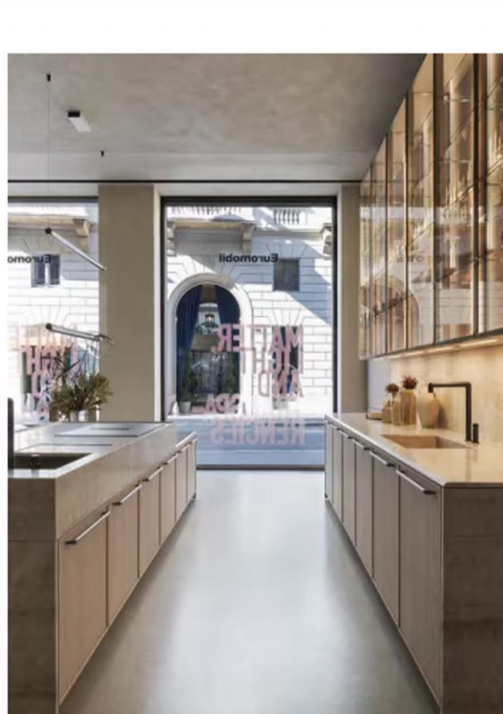
Margo celebra il rigore e l'eleganza strutturale attraverso la cornice perimetrale di 14 mm, segno sottile che racchiude il senso profondo del progetto: precisione, equilibrio e savoir-faire manifatturiero.

Il marmo Rosso Levanto , scelto per il top dell'isola Antis e della nuova madia, amplifica la ricercatezza materica e segna l'apertura di Euromobil al mondo del living, tracciando una connessione tra funzionalità e interior design.