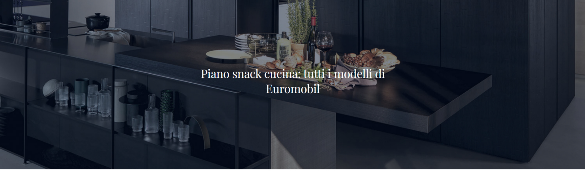
Piano snack cucina: tutti i modelli di Euromobil

La cucina è il cuore della casa, e la sua funzionalità è cruciale. Con l'evoluzione degli spazi abitativi, il piano snack cucina di Euromobil si afferma come un elemento essenziale, che unisce estetica e praticità. Questo elemento, che può fungere da sostituto al tradizionale tavolo , si presta a diverse funzioni, dalle colazioni veloci agli spuntini informali e persino come piano di lavoro o di studio.