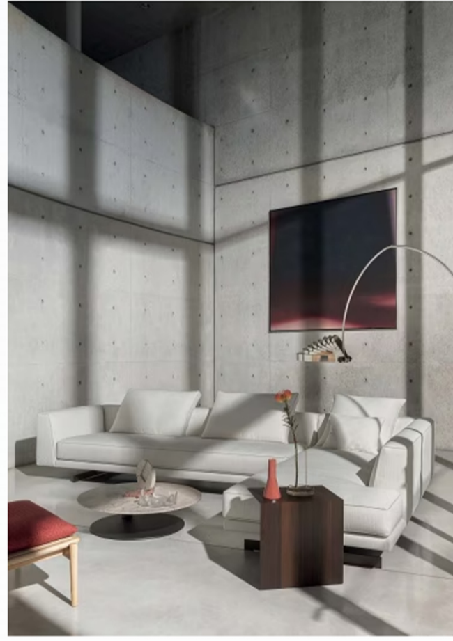
Il divano Sheridan, design Matteo Thun & Antonio Rodriguez.

La collezione è stata infatti fotografata nella cornice di Fabrika e Villa Pastega Manera, nel Trevigiano. Luogo tributo al territorio, all'arte, all'architettura, simbolo della capacità di incontro di tradizione e innovazione, valori fondanti di Désirée e Gruppo Euromobil. Nella campagna veneta di Villorba, il complesso di Villa Pastega Manera (XVII secolo), è stato restaurato e ampliato dall'architetto giapponese Tadao Ando per dar vita a Fabrika.