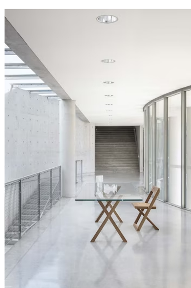
La collezione Ciacola disegnata da Tobia Scarpa.

Tra colonne affacciate su grandi specchi d'acqua, con porticati come quinte di un teatro immaginario oppure accostate alle pareti di cemento liscio e vetro, trovano posto sedute, un grande tavolo per la convivialità, poltroncine e complementi dai tratti essenziali. Esaltando materiali semplici come legno, vetro, cuoio, le novità 2023 di Désirée sono pensate per immaginare l'abitare del futuro sulle tracce del passato.