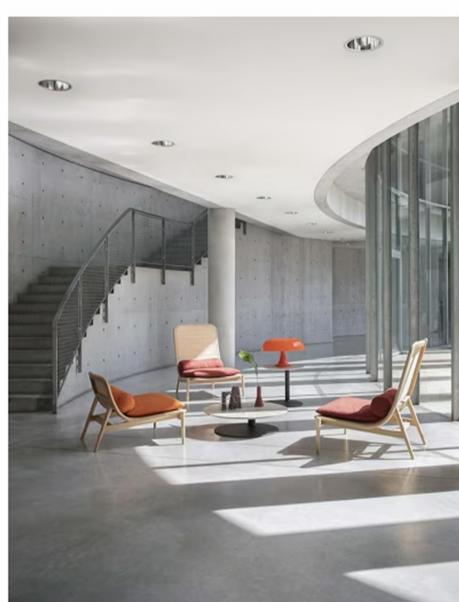
Le poltrone Eben, design Matteo Thun & Antonio Rodriguez.

In uno spazio dall'atmosfera sospesa, che fonde storia e modernità, le forme geometriche degli edifici progettati dall'architetto minimalista dialogano con le arcate dell'antica villa, con la natura, con la luce, e sono riecheggiate dal tratto essenziale della collezione Désirée 2023.