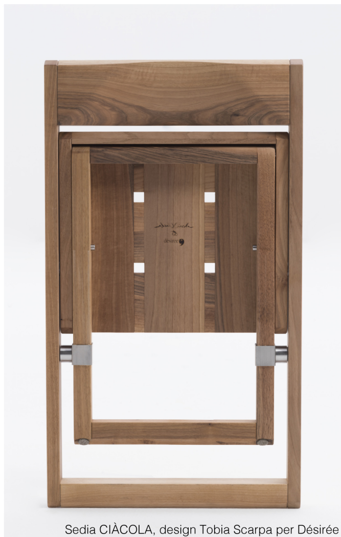
Sedia CIÀCOLA, design Tobia Scarpa per Désirée

L'azienda DÉSIRÉE ha presentato due prodotti disegnati da Tobia Scarpa: si tratta della collezione CIÀCOLA composta da una sedia pieghevole e un tavolo. La sedia ha una struttura in legno di noce con giunture in acciaio e una seduta con semplici incastri. Il tavolo, con piano in vetro trasparente, ha anch'esso una base in legno di noce e gambe che s'incrociano tramite giunture in metallo formando una X ed è una rivisitazione minimalista del tavolo fratino al quale è stato eliminato il "trait d'union" tra i due elementi formanti le gambe.