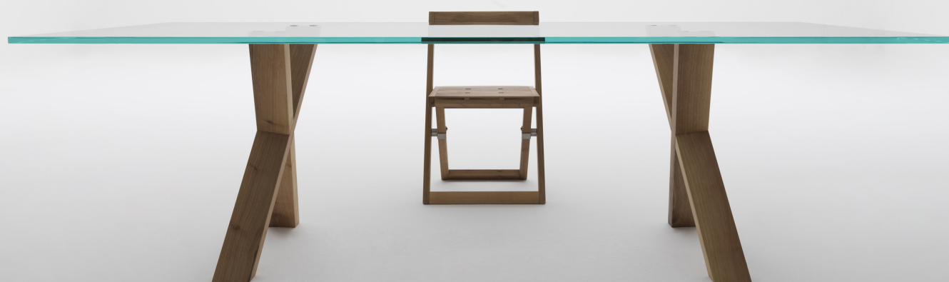
Tavolo CIÀCOLA, design Tobia Scarpa per Désirée