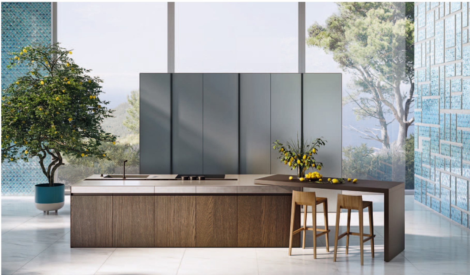
Euromobil Kitchen SEI, nuovissima produzione del 2023 firmata Marc Sadler

mondo, risultato ottenuto grazie anche all'inaugurazione di Flagship store in città come Dubai e Città del Messico. Euromobil non solo conquista la fascia medio-alta del mercato, ma riesce anche a raggiungere un pubblico molto più ampio grazie alla possibilità di personalizzare particolari precisi della propria cucina dei sogni, come colori e finiture, consentendo al prodotto finale di raggiungere un costo adeguato mantenendo un'estetica peculiare. "Viviamo il design come un concetto democratico, un design che sia accessibile e disponibile per chiunque ne voglia usufruire. Per noi la competitività è sinonimo di stimolo nella