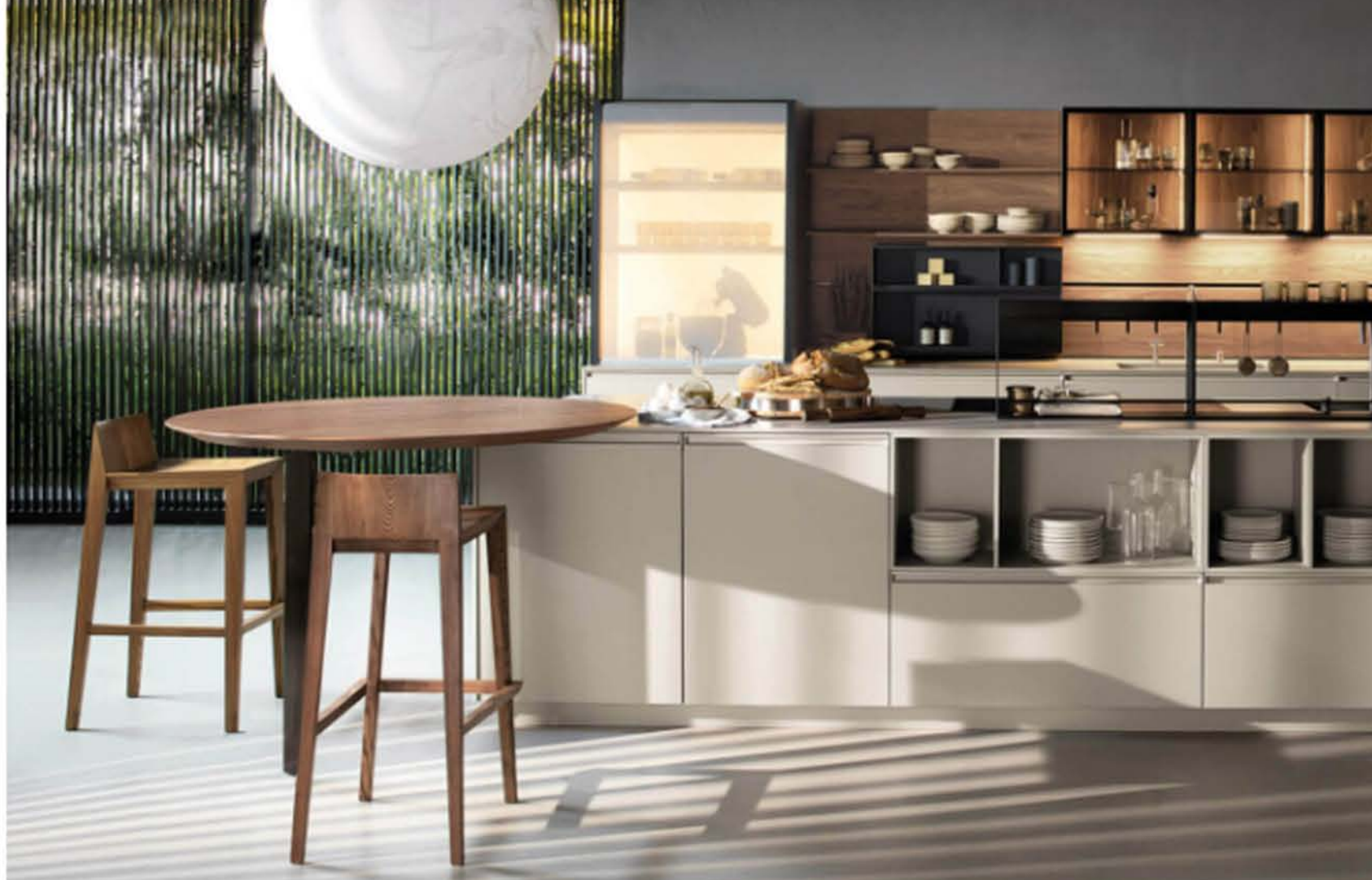
Piano snack Rondò

Per i pasti informali in una cucina moderna non può assolutamente mancare il piano snack . Noi abbiamo un debole per il modello Rondò , il tavolo rotondo in legno massello elegantemente bisellato, con la gamba d'appoggio singola in alluminio.