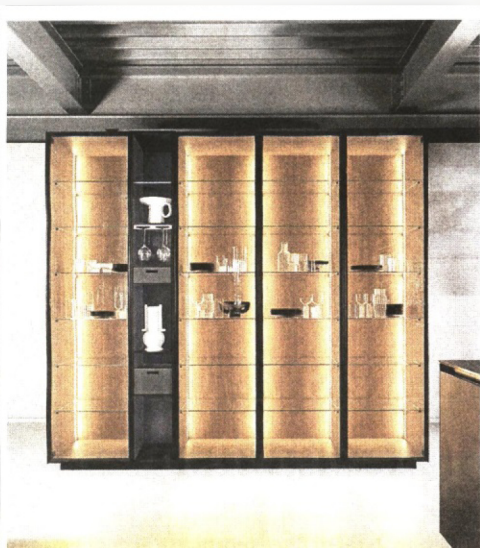
▲ Soluzione Puzzle Teca è la nuova vetrina di Euromobil con cerniere a scomparsa. All'interno, Puzzle I2: il sistema di colonne a giorno con accessori