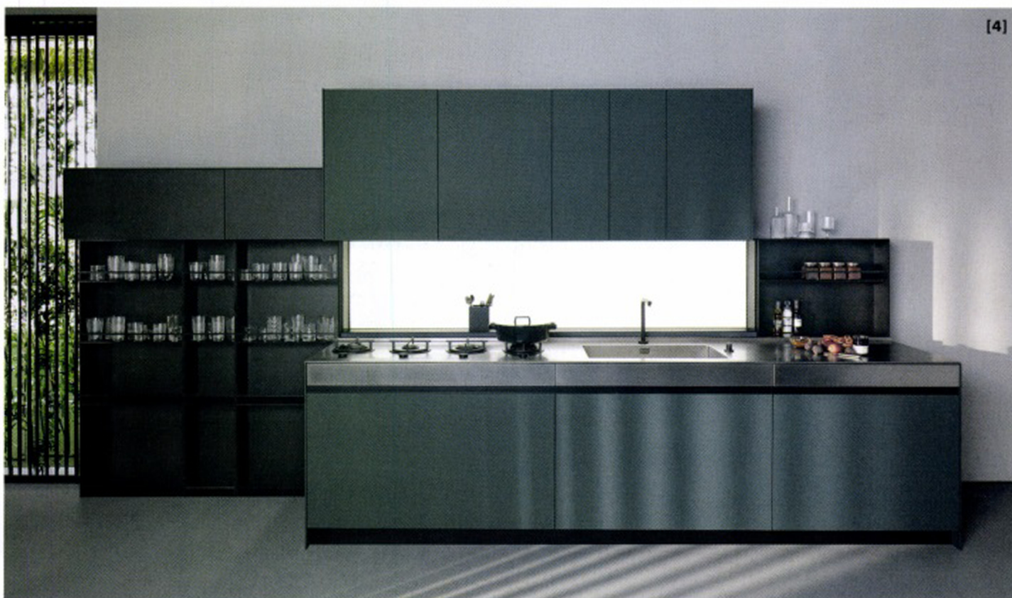
4. Sei di Marc Sadler per Euromobil è una cucina definita da elementi sartoriali. In foto, la composizione con schienale attrezzato, colonne a giorno e basi in Fenix NTM® verde e acciaio. euromobil.com

Il sistema Sei di Marc Sadler per Euromobil è una cucina definita da elementi sartoriali. In foto, la composizione con schienale attrezzato, colonne a giorno e basi in Fenix NTM® verde e acciaio. euromobil.com