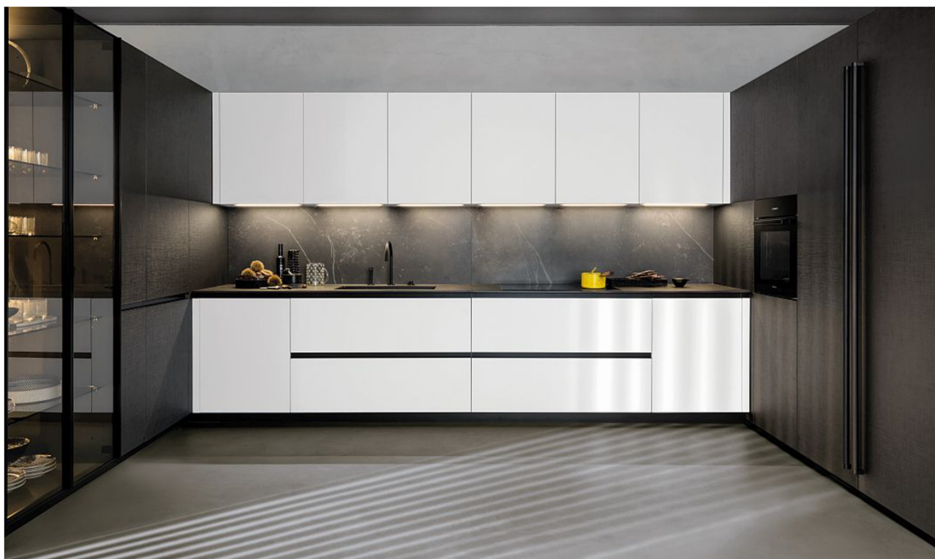
Euromobil: la cucina Lain Respet®