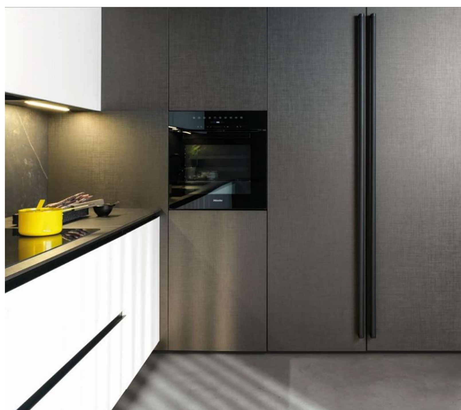
Euromobil: le nuance a contrasto della cucina Lain Respet®

Il progetto di Respet® è stato sviluppato in due anni di ricerca da 3B , azienda della provincia trevigiana, ed è stato premiato con il Product design Reddot Award . Chiamata con un nome si riferisce al rispetto e a riciclo ecosostenibile del PET, la produzione della finitura Respet® ha inizio dalla selezione della plastica proveniente dalla raccolta differenziata , il particolare processo produttivo che poi, dalla bottiglia forma il granulo e successivamente poi l'estruso per diventare infine il primo strato di rivestimento di un pannello per mobili contenitori, ottenuto impiegando una resina PET riciclata al 100% , il cui processo di produzione non impiega combustibili fossili e consente la riduzione del 60% di emissioni di CO2.