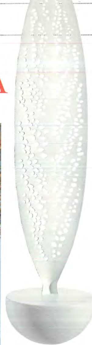
SEMPRE IN PIEDI Lovely Breeze di Alessi è un contenitore a dondolo, da usare come centrotavola, fruttiera, portadolci o svuotatasche (€ 98).